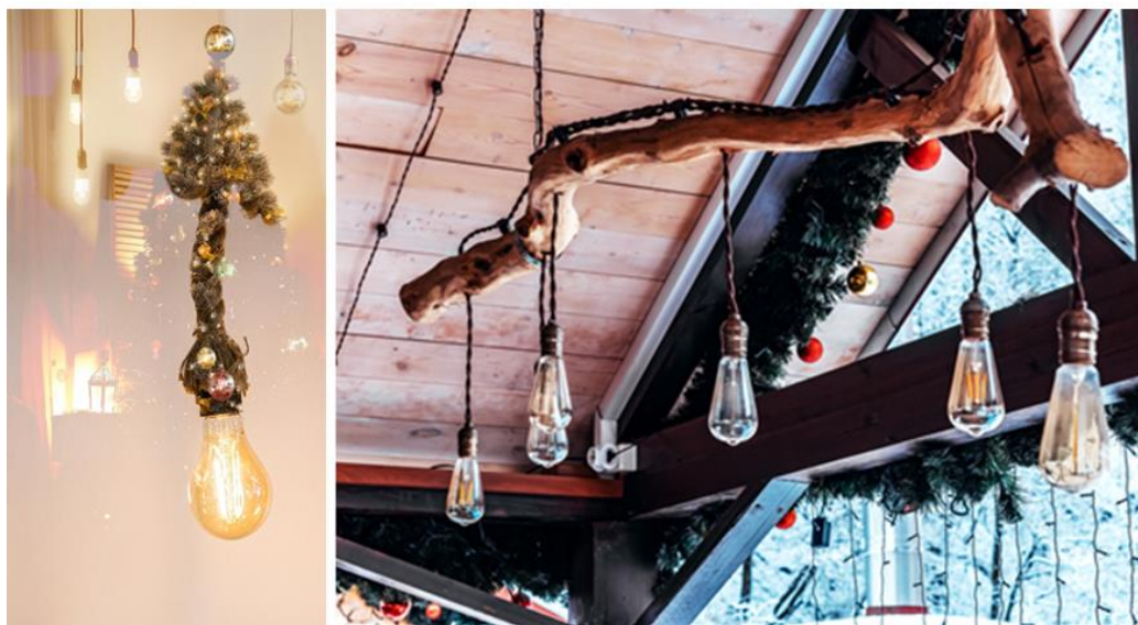
Quelques idées de suspensions originales pour les décorations de Noel ci-dessus